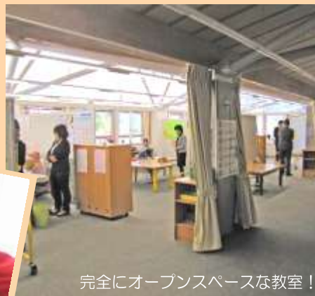
完全にオープンスペースな教室！